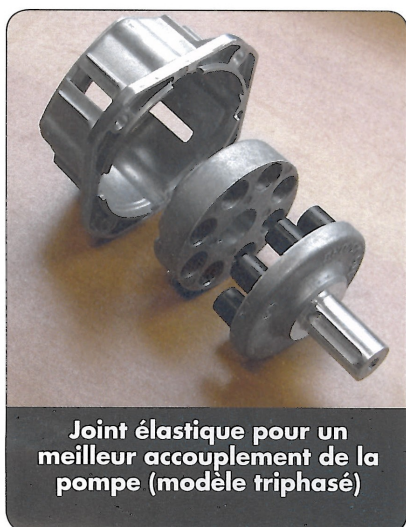
Joint élastique pour un meilleur accouplement de la pompe (modèle triphasé)